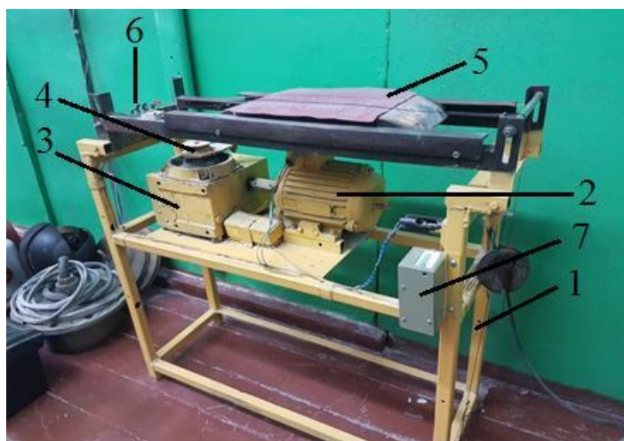
Рисунок 1 - Экспериментальная установка для определения величины износа при абразивном трении рыболовных текстильных материалов:

1-фундаментная рама, 2-электропривод, 3-редуктор, 4-кривошипно-шатунный механизм, 5-подвижная истирающая поверхность (каретка), 6-концевые выключатели, 7-счетчик циклов.