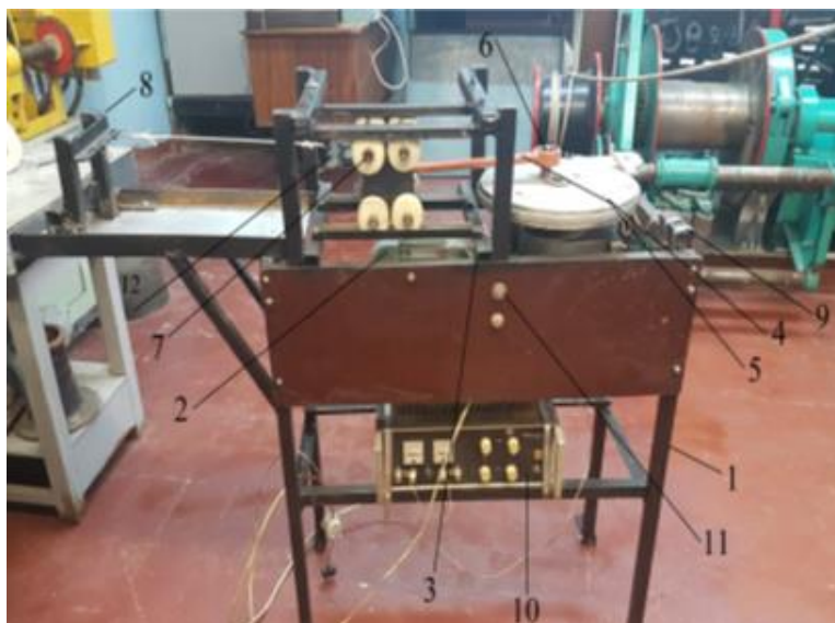
Рисунок 3 - Экспериментальная установка для определения величины износа при циклических нагрузках рыболовных текстильных материалов:

1-фундаментная рама; 2-электропривод; 3-втулочно-пальцевая муфта; 4-червячный редуктор; 5-кривошипно-шатунный механизм; 6-эксцентриковое устройство; 7- подвижная каретка; 8-неподвижная траверса с крючками; 9-электромеханический счетчик циклов; 10-блок питания счетчика; 11-пульт управления электроприводом; 12-устройство для корректировки амплитуды нагружения