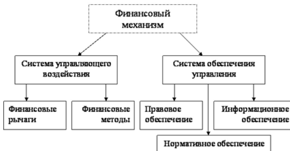
Рисунок 1 - Схема финансового механизма на предприятии

Ключевые цели управления финансами предприятия — это максимизация прибыли, капитализации (рыночной стоимости) и платёжеспособности (ликвидности) компании в целях удовлетворения интересов собственников. Реализация этих целей входит в обязанности руководителя финансового подразделения организации.