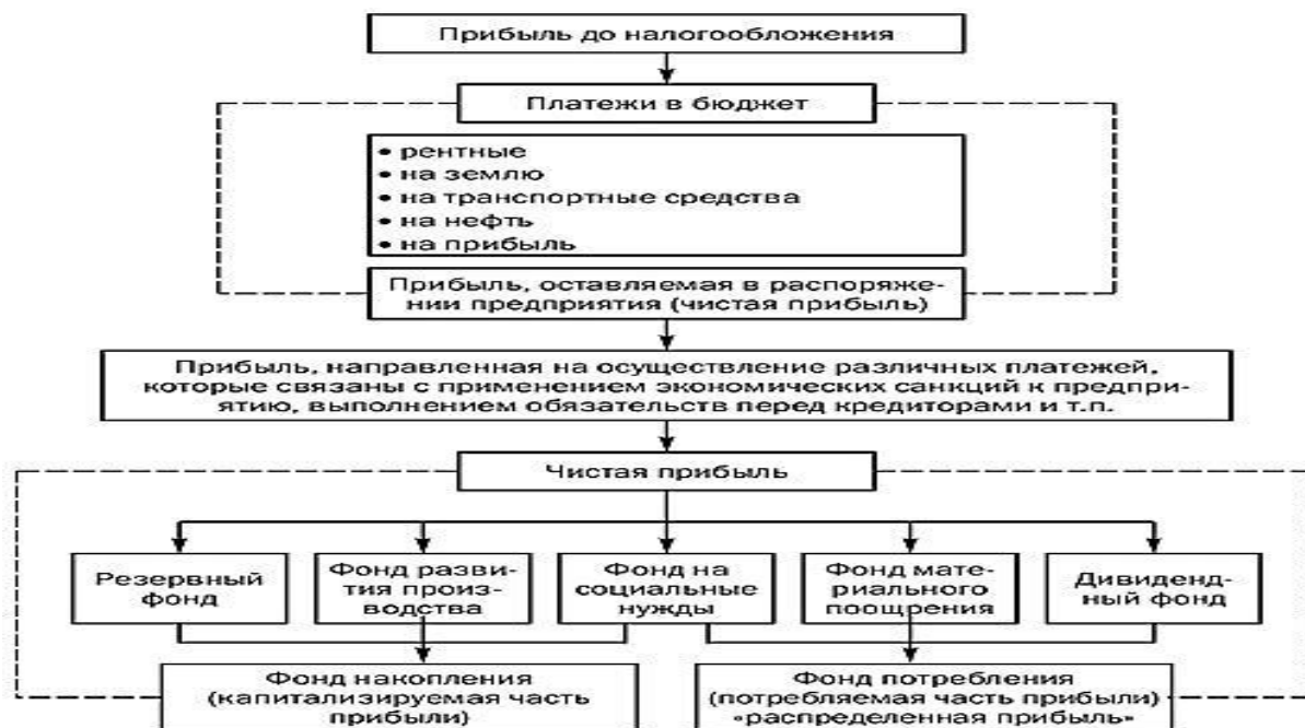
Рисунок 7 - Основные направления распределения прибыли

закономерность нормального функционирования организации в рыночной экономике. Систематическая нехватка прибыли и ее неудовлетворительная динамика свидетельствуют о неэффективности бизнеса. Направления использования прибыли представлены на рисунке 7.