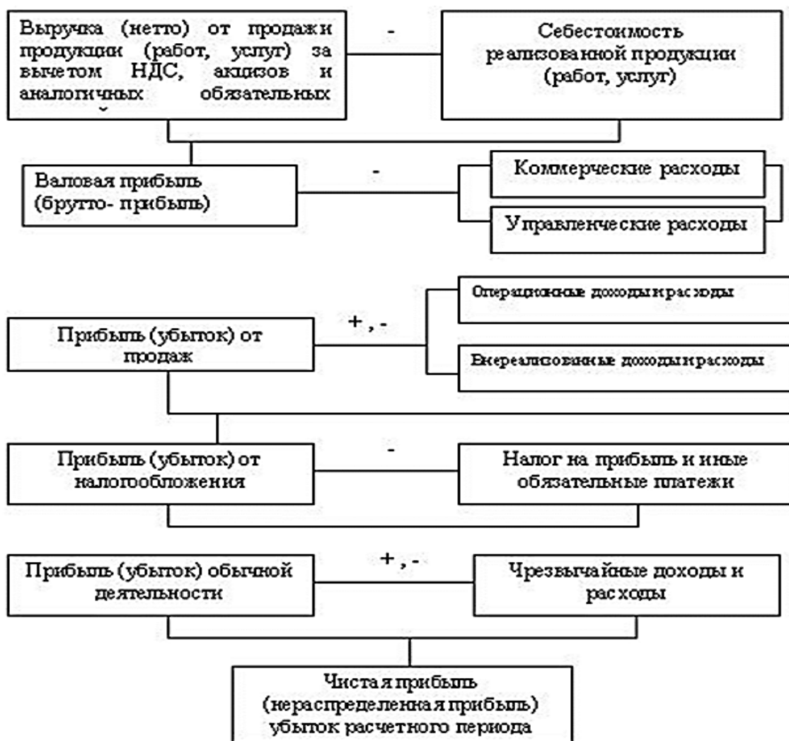
Рисунок 5 – Формирование финансового результата предприятия

Вопрос 2. Механизм формирования, распределения и использования прибыли. Характеристика направлений использования прибыли предприятий.