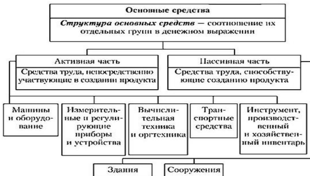
Рисунок 2 – Состав основных средств

Видовая структура фондов отражает специфику отрасли. В добывающих отраслях преобладают сооружения и передаточные устройства, в обрабатывающих отраслях – рабочие машины и оборудование.