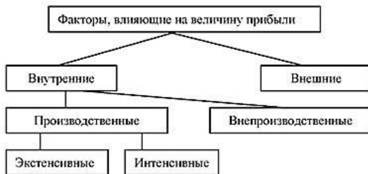
Рисунок 8 – Факторы, влияющие на увеличение прибыли.

При распределении прибыли, определении основных направлений ее использования прежде всего учитывается состояние конкурентной среды, которая может диктовать необходимость существенного расширения и обновления производственного потенциала предприятия.