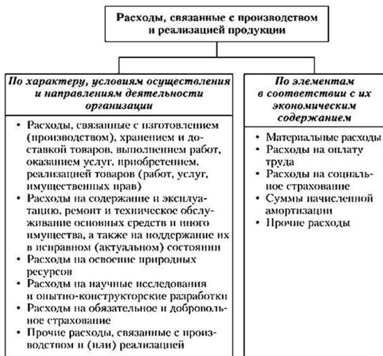
Рисунок 4 – Состав расходов, связанных с производством

Расходами, связанными с производством и реализацией, являются расходы, на изготовление продукции и ее продажу, приобретение и продажу товаров, выполнение работ, оказание услуг.