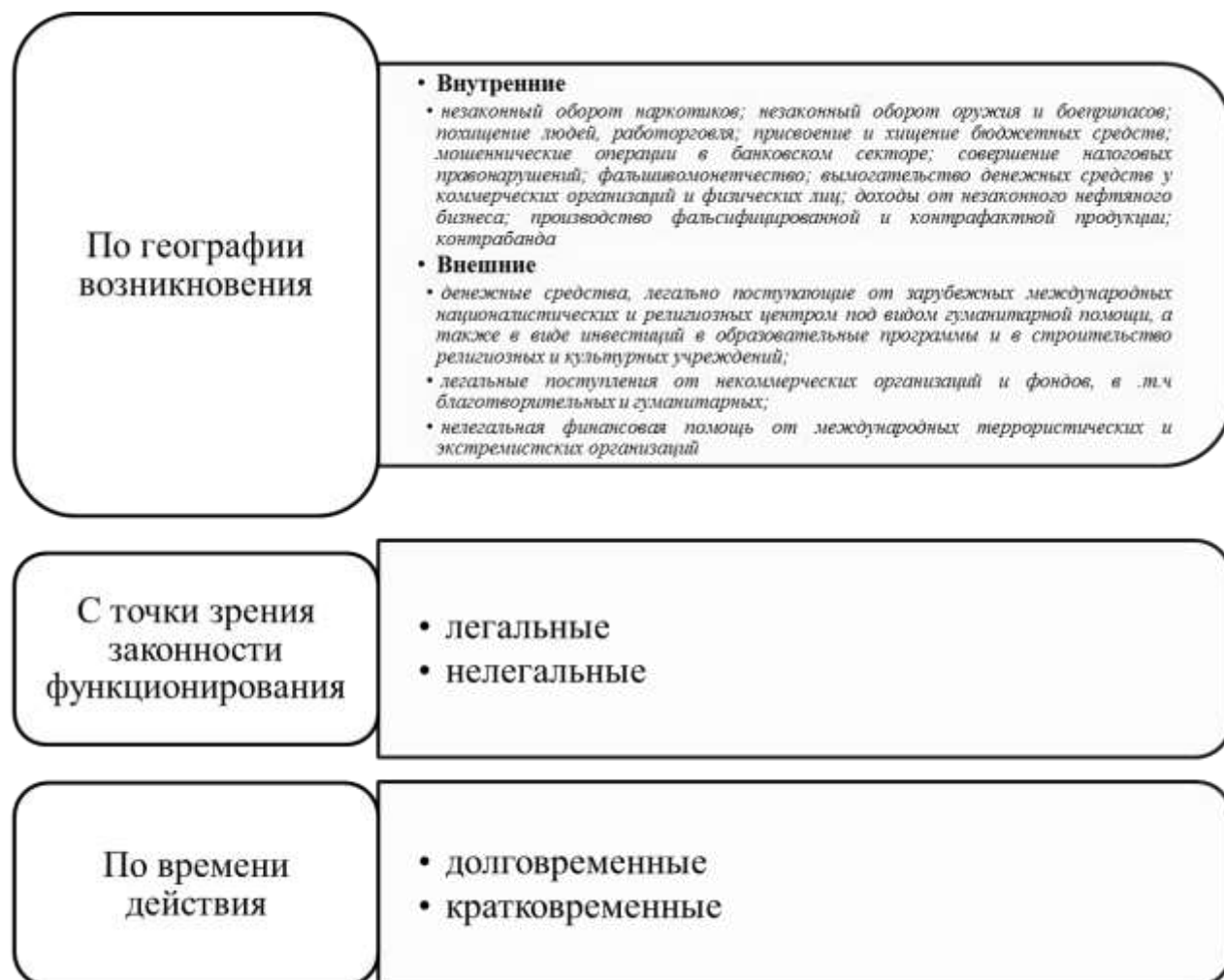
Рисунок 4 – Классификация источников финансирования терроризма

Распространению терроризма в значительной степени способствует его финансирование, которое в ряде случаев имеет решающее значение для осуществления и развития международных террористических организаций (рис. 4).