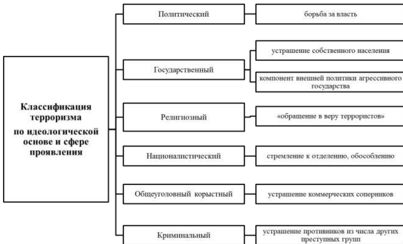
Рисунок 2 - Классификация терроризма по идеологической основе и сфере проявления

Рабочая программа «Противодействие терроризму» является приложением к рабочей программе воспитания и предназначена для основных профессиональных образовательных программ бакалавриата, специалитета по направлениям подготовки в БГАРФ ФГБОУ ВО «Калининградский государственный технический университет». Обучающиеся должны: