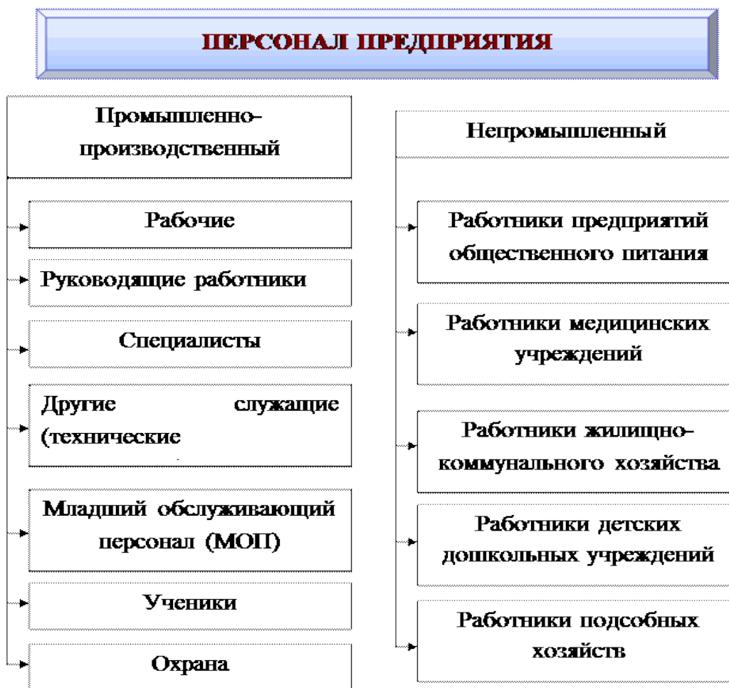
Рисунок 1 – Состав и классификация персонала

Вопрос 2. Анализ возрастной, образовательной и квалификационной структуры кадров предприятия.