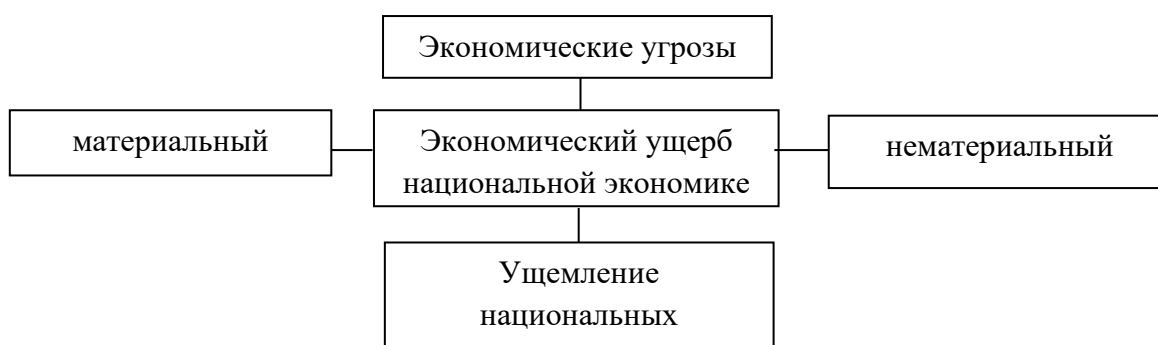
Рисунок 2. Характер воздействия угроз на ЭБС государства

Характер воздействия угроз на ЭБС государства, в какой бы сфере они не наблюдались, заключается в нанесении ими экономического ущерба национальной экономике, и, в конечном итоге, в ущемлении национальных экономических интересов (рисунок 2).