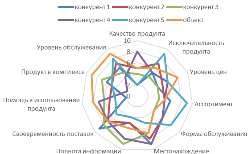
Рисунок 2 – Конкурентные преимущества организации

По желанию в целях наглядности данные таблицы 6 можно дополнительно представить в виде лепестковой диаграммы (рисунок 2).