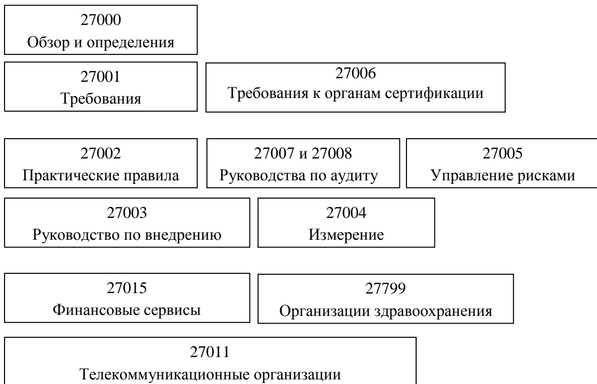
Рисунок 1 – Обзор стандарта серии 27000

В стандарте приведен обзор серии 27000 (рис. 1), представлено введение в СУИБ, являющееся предметом рассмотрения данной серии стандартов. Также определены требования к СУИБ и к их оценке соответствия, в том числе для тех, кто сертифицирует эти системы; описан цикл PDCA, а также введены термины и определения, используемые в стандартах серии 27000.