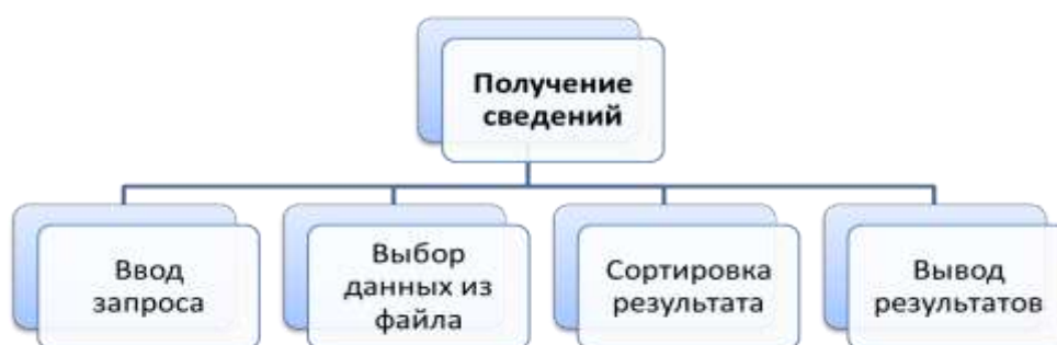
Рис. 1. Пример декомпозиции задачи курсового проектирования на процедуры

Тестовый файл, содержащий исходную информацию для решения задачи информации должен содержать 10-15 записей, но значения элементов должны обеспечивать проверку правильности программы для различных вариантов решения задачи (получения упорядоченных сведений, получения таблицы с одной строкой и т.п.).