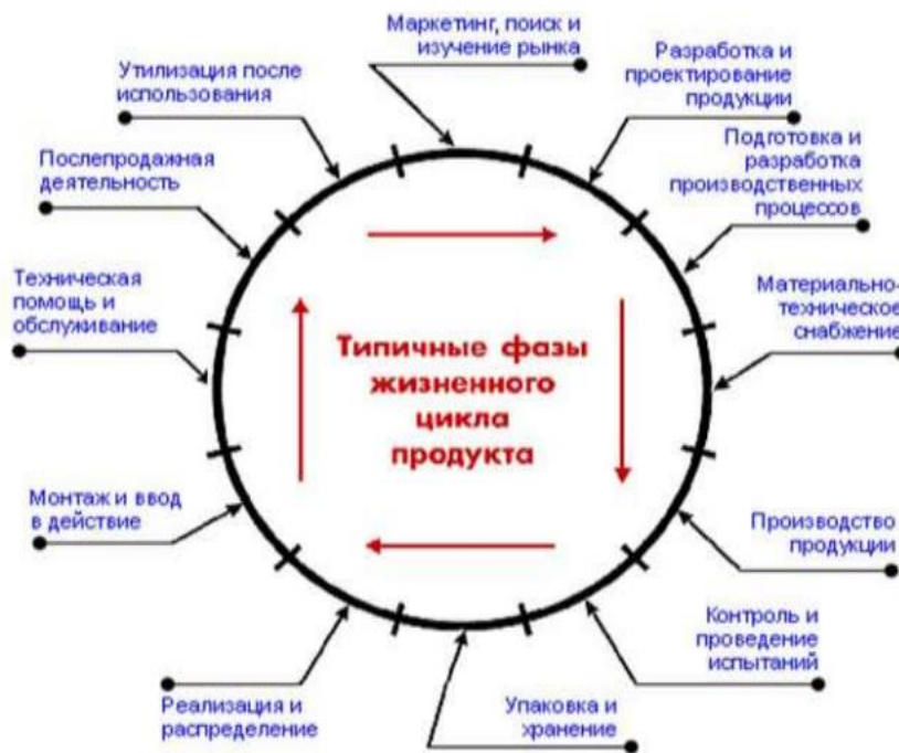
Рисунок 1 – «Петля качества» в системе менеджмента качества

Система качества разрабатывается с учетом конкретной деятельности предприятия, но в любом случае она должна охватывать все стадии жизненного цикла продукции – «Петли качества» (рисунок 1).