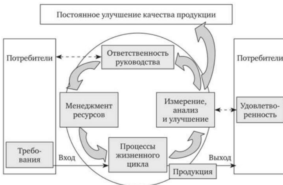
Рисунок 2 – Модель системы менеджмента качества, основанной на процессном подходе согласно ГОСТ ISO 9001–2011

При внедрении систем качества значительная роль отводится документации, которая очень важна: